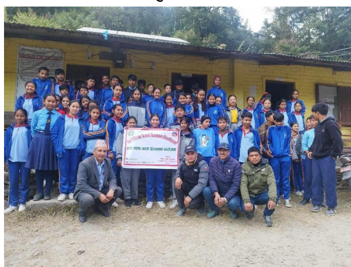
ईको क्लव संचालन सम्बन्धि कार्यक्रम