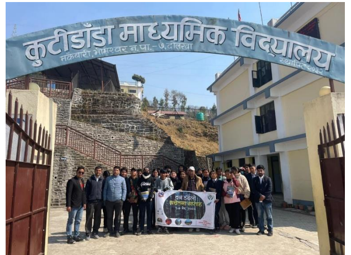
डडेलो सचेतना ससाहको अवसरमा विद्यालय अनुशिक्षण