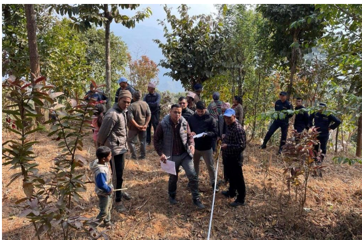
मेलुङ गा.पा. १ मुलपानी सा.ब. को बृक्षारोपण क्षेत्रको अतिक्रमण हटाउने क्रमको नापजाच