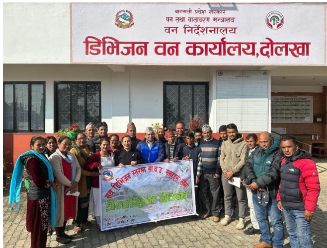
सब डिव.का. स्तरिय सा.व.समूहहरू संगको त्रैमासिक बैठक