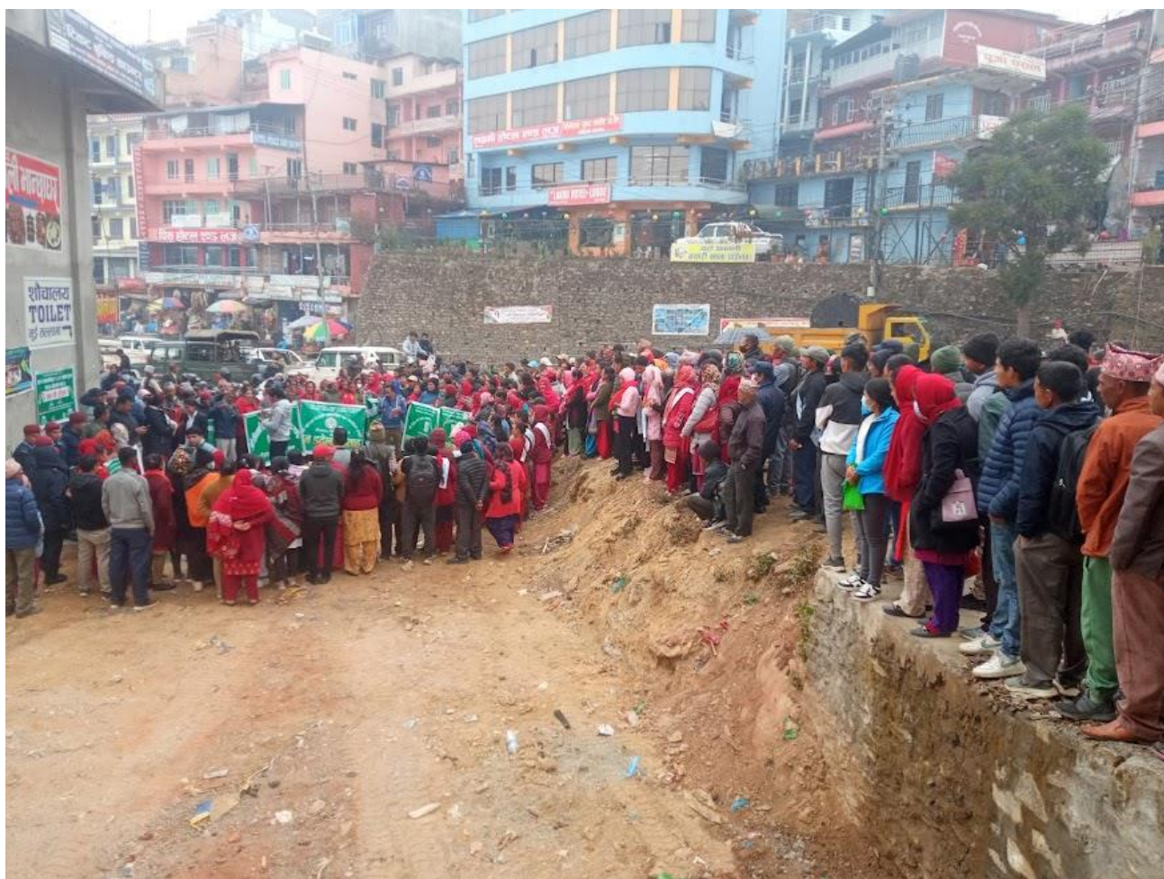
डडेल्दुला सचेतना सप्ताहको अवसरमा डिभिजन वन कार्यालय दोलखाले आयोजना सडक नाटकका दर्शकहरू