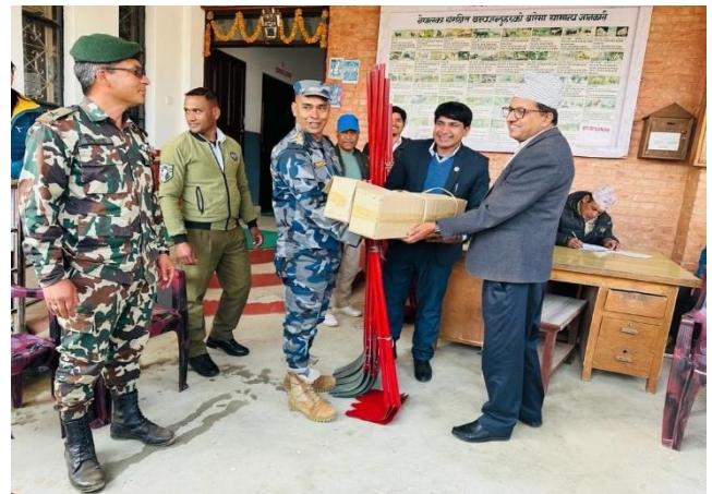
सुरक्षा निकायहरूलाई डडेलो नियन्त्रण सामग्री हस्तान्तरण