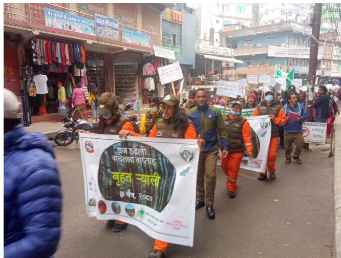
डडेल्दुला सचेतना सप्ताहको अवसरमा डिभिजन वन कार्यालय दोलखाले आयोजना गरेको बृहत र्याली