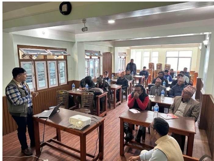
सा.व.उ.स समूहलाई लेखा तथा अभिलेख व्यवस्थापन तथा माईनुट लेखन तालिम