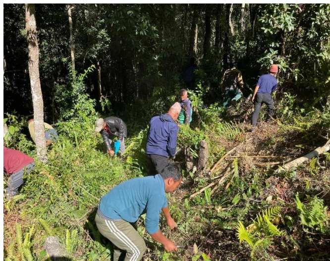
वन व्यवस्थापन स्थलगत अभ्यास